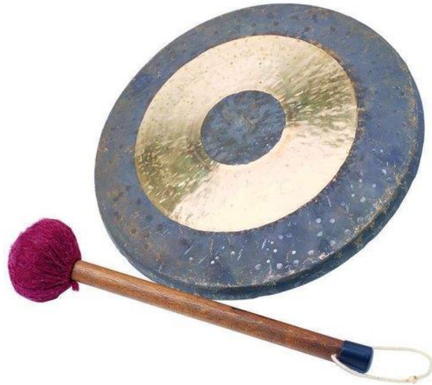
编号: 89274