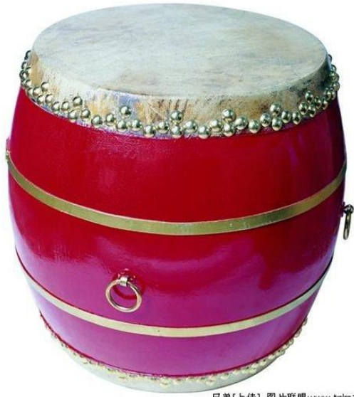
兄弟[上传] 图片联盟www.tplm123.com